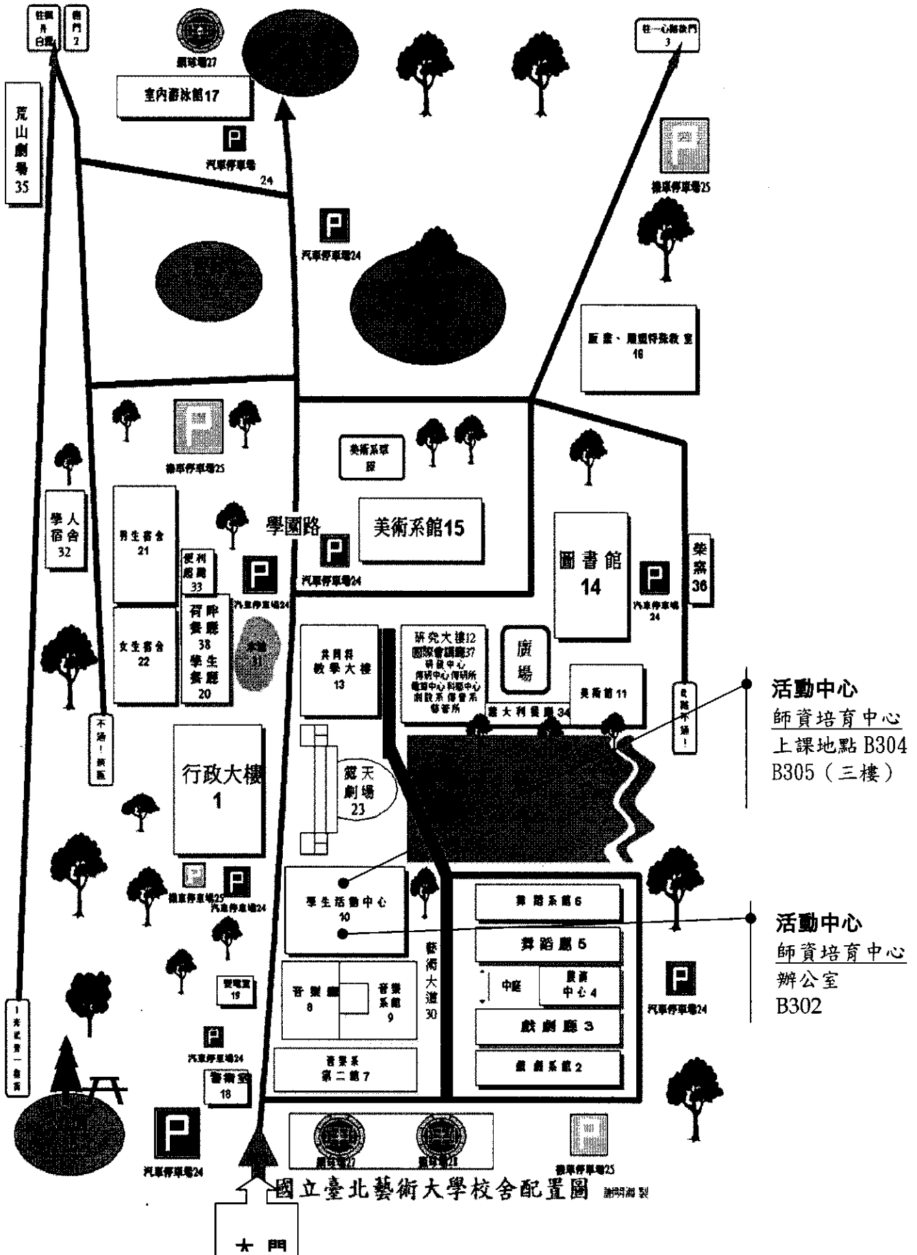
國立臺北藝術大學校舍配置圖 謝明海製